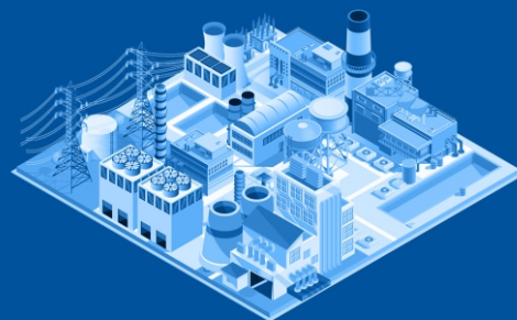
Объекты критической инфраструктуры